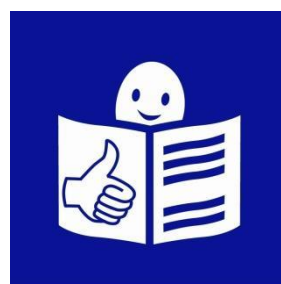
Logotipo europeo de lectura fácil: © Inclusion Europe.