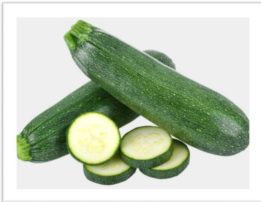
Zapallos italianos.

Adaptado de: texto escolar Leo Primero tercero básico.