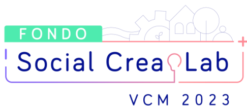
Logotipo de proyecto Social Crea Lab Universidad de Playa Ancha

Ministerio de Educación Gobierno de Chile.